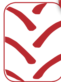
Maximo Radial 85